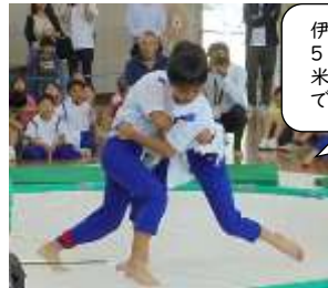
伊吹山 TV 5月31日(金)から1週間放送 米原市役所 YouTube チャンネル での配信は翌週の月曜日

5月24日には、地域の皆様のご協力のもと、すもう大会を開催しました。午前中は各学年の大会を、午後には横綱決定戦を行いました。すもう大会に向けて練習にはげみ、応援のマナーや盛り上げ方を学び、新聞やポスターづくりや化粧まわし制作などを含め、子どもたちはさまざまな経験を積みました。勝負の世界です、喜びもあれば悔しさもありました。そこで仲間と切磋琢磨しながら、自分のよさや弱さと向き合うことができたと感じました。今回のすもう大会でも、自己肯定感と自己有用感が高まったように思います。